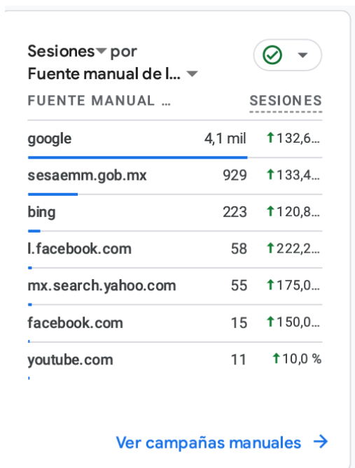
Gráfico de acceso por consulta de 4,3 mil usuarios activos (de octubre a marzo).

En general, los datos indican un desempeño positivo y un aumento considerable en la atracción y retención de usuarios. Del mismo modo el acceso al sitio web en el periodo mencionado denota que se ha accedido por diversos navegadores: